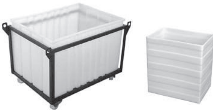
VRO-270 mit Fahrgestell in Sonderausführung