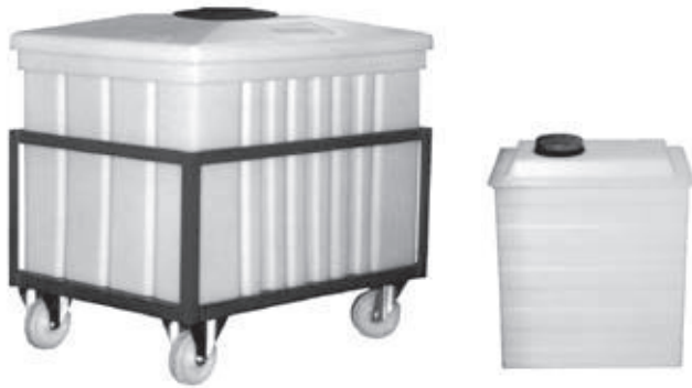
VRC-300 mit Rollgestell