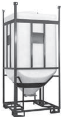
TB 18-2/P + Schieber GH