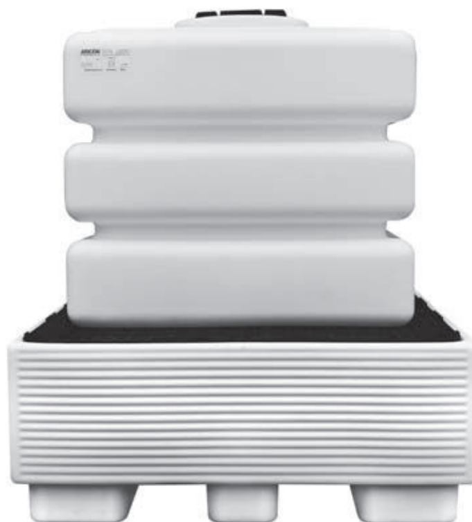
TK-500 auf Auffangwanne WRP-600