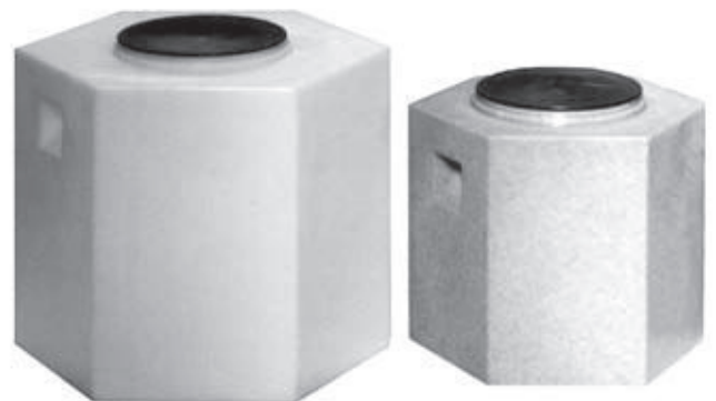
ES-91 / ES-45