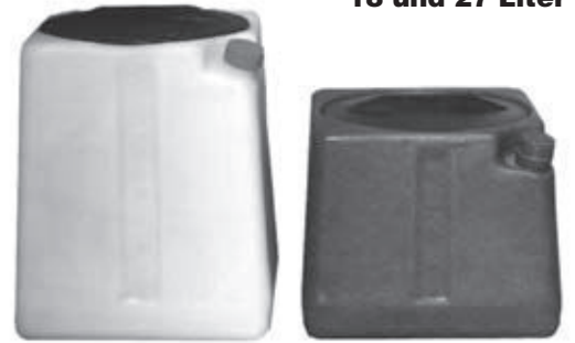
M-27 / M-18 schwarz