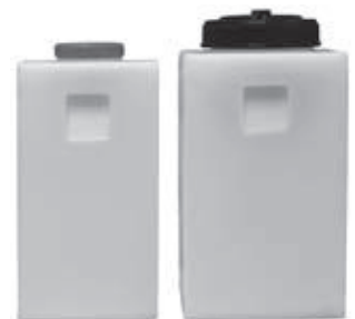
PRL-14 / PRL-25