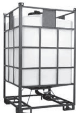
IBC-TN/18 + Armatur