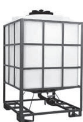
IBC-TN/18 + Armatur