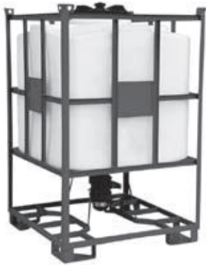
IBC-TN/10 + Armatur